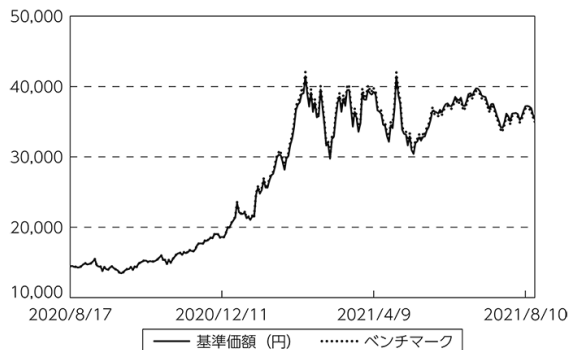
基準価額等の推移

(注) ベンチマークは期首の値をファンド基準価額と同一になるよう指数化しています。