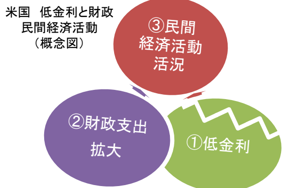
【図3】FOMCはこのトライアングルは崩さないと予想

注）2020年5月7日の線グラフは、「市場は同日の60ヵ月後に初回利上げその後1年間利上げ無し」を表す。黒線はFRBが許容しないと想定される利上げ開始時期とその後1年間の利上げ回数（2021年中に利上げ開始、その後1年で更に3回以上利上げ）。短期金利は銀行間取引金利（オーバーナイト・インデックス・スワップ）6ヵ月物を使用。FOMCは2024年以降の利上げを想定。FRBが許容しないゾーンは当社経済調査室の予想。