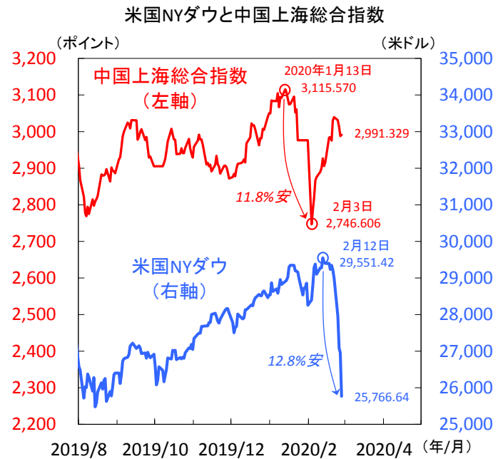
【図1】2月に入り調整局面を迎えた米国株式

株価底固めには、中国外の感染拡大に歯止めがかかることが条件です（図2）。そうなれば世界的流行の懸念が薄れ、主要国の金融・財政政策などを追い風に、景気回復期待を高めていくとみえます。目先こそ景気指標悪化が見込まれ株価は調整余地を残すものの、景気が一時的減速に終わった2003年SARSや2014年エボラ出血熱問題時と同様、徐々に落ち着く展開を予想します（図3）。（瀧澤）