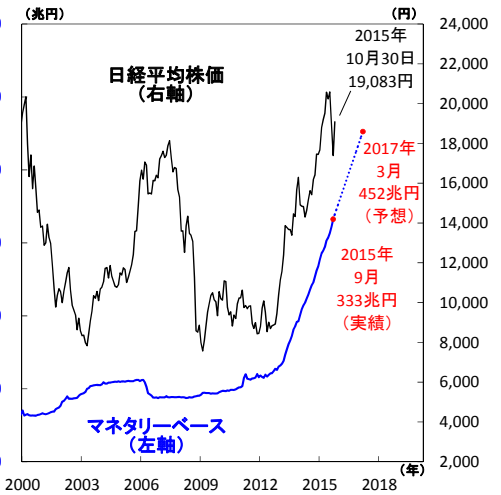
日本 マネタリーベースと日本株

日銀の大量資金供給は、日本国債の利回り低下と物価見通しの上昇を促し、資金が国債などから日本株や海外証券などの資産に向かうことで、景気回復や物価上昇を狙っています。今後の金融市場は、世界景気の回復が予想される中、日銀の量的金融緩和が2016年を通じて継続することが見込まれるため、当面の間、円安ドル高や日本株高の地合いが予想されます(図2右)。(石井)